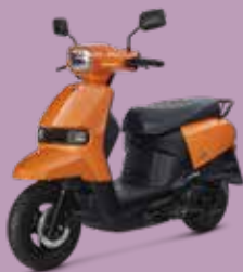
| 限量 | 翻糖橘